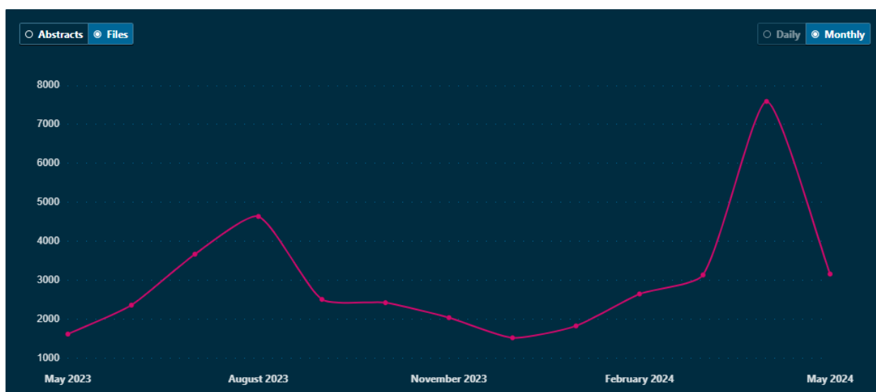
Figure 1 Monthly usage data for CAML Review from May 2023 - May 2024 based on access to PDF files

Usage of CAML Review over the last year is consistent with previous years, where access to the journal articles (through access to PDF) seems to increase in the months after each issue is published. Views of all articles total are typically between 1500 – 6000 per month.